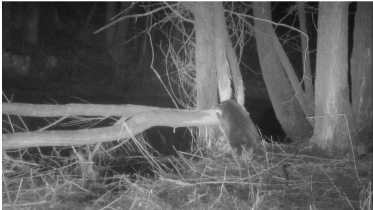
Il castoro al «lavoro» di notte lungo il Toce

08 Gennaio 2024 Aggiornato alle 12:33 2 minuti di lettura