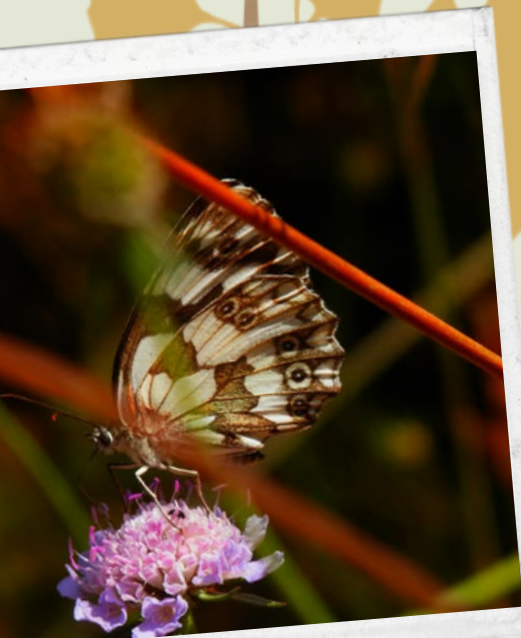
Greta Di Vito - Galatea