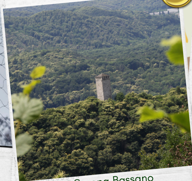
Serena Bassano Torre del Buccione