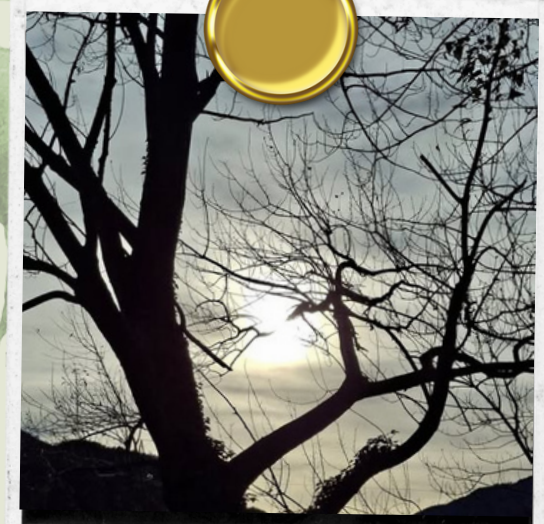
Danilo Vassura - Fondotoce