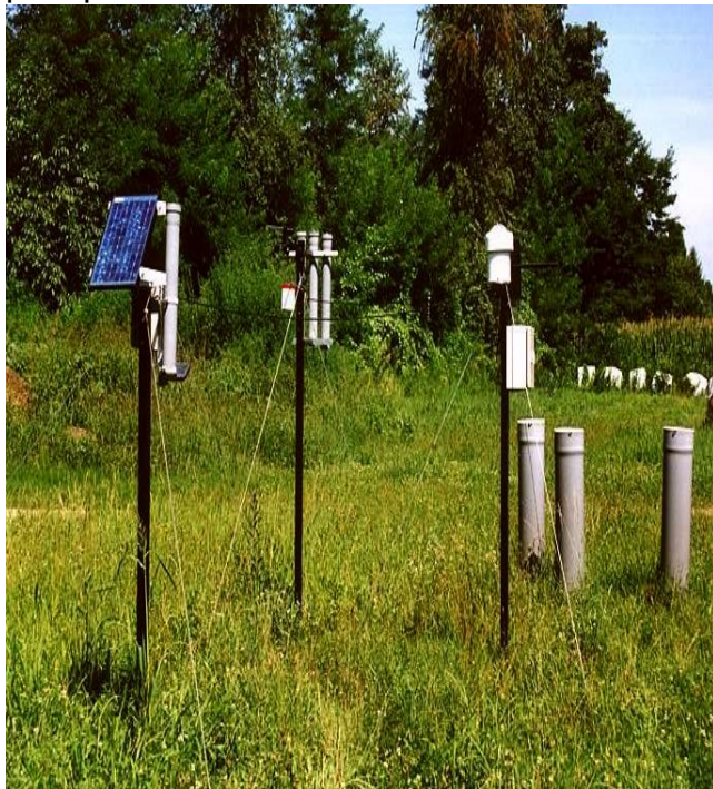
Strumenti per la misura degli inquinanti e per la raccolta delle precipitazioni presso Castelletto Ticino

La valutazione delle deposizioni atmosferiche umide, cioè della qualità dell'acqua che si deposita sui nostri ambienti di vita, viene realizzata raccogliendo le precipitazioni meteoriche (pioggia e neve) e sottoponendo i campioni ad analisi chimica. La raccolta delle precipitazioni avviene settimanalmente.