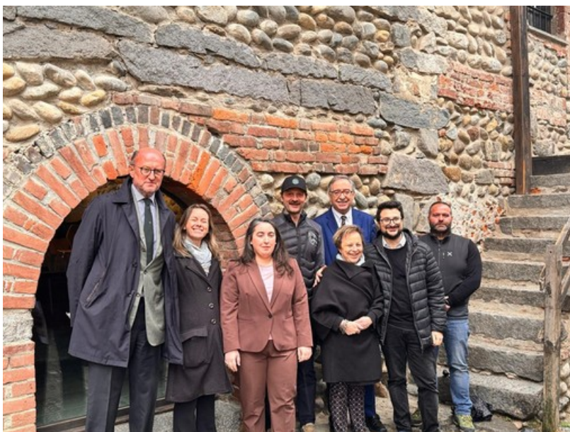
Candelo fra storia e futuro tecnologico: percorsi di visita all'insegna dell'innovazione

Candelo è pronto a presentare il nuovo percorso di visita multimediale al Ricetto, una novità straordinaria che unisce tradizione e innovazione, consentendo ai visitatori di immergersi completamente nella storia del borgo medievale e del Medioevo.