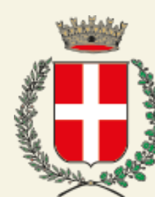
COMUNE DI OLEGGIO