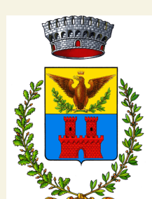
COMUNE DI CAMERI