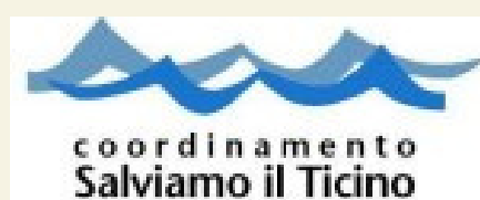
coordinamento Salviamo il Ticino

L'iniziativa sarà in totale sicurezza seguendo le norme anti Covid