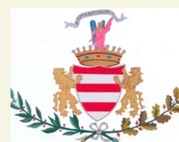
COMUNE DI ROMENTINO