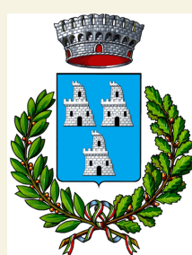
COMUNE DI BELLINZAGO NOVARESE

L'iniziativa è realizzata grazie al contributo delle associazioni del territorio (LEGAMBIENTE, AIB, UNPLI-NO, COORDINAMENTO SALVIAMO IL TICINO ecc...).