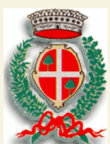
COMUNE DI CERANO