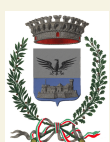
COMUNE DI CASTELLETTO TICINO