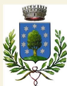
COMUNE DI BORGO TICINO